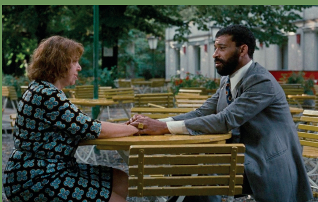
Lunedì 29 aprile 2024 h. 17.30 La paura mangia l'anima (1973, 89', v.o.s.)