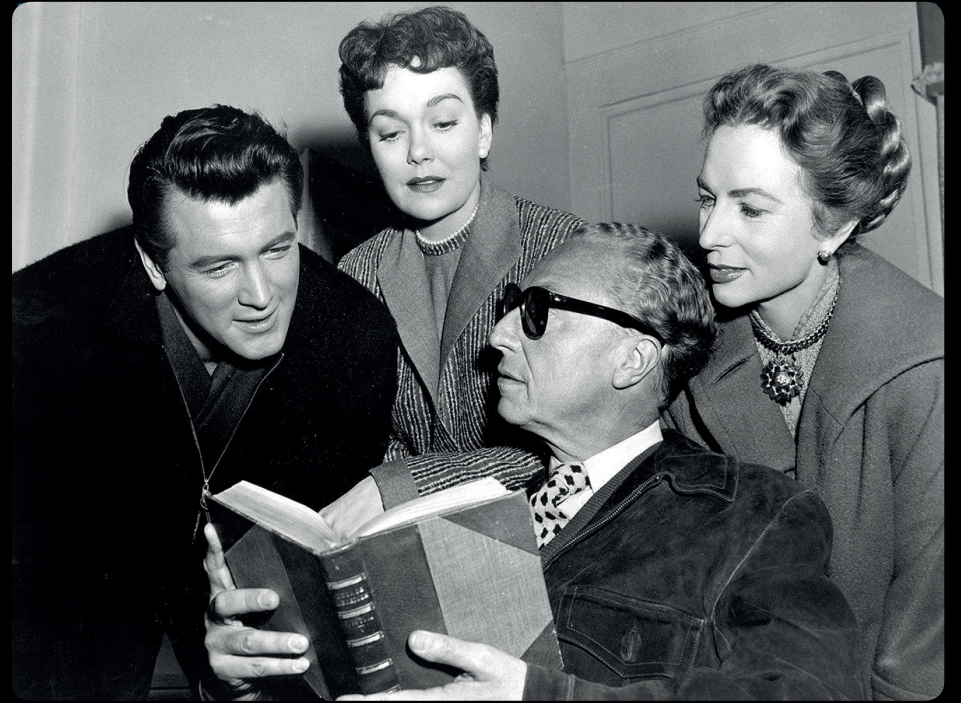
Image: Publicity photo from the set of the 1955 film All That Heaven Allows, 1955.