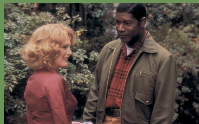
Lunedì 13 maggio 2024 h. 17.30 Lontano dal paradiso (2002, 102', v.o.s.)