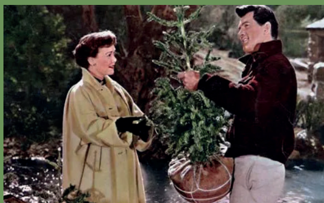
Lunedì 22 aprile 2024 h. 17.30 Secondo amore (1955, 85', v.o.s.)

CASA DEL CINEMA - VIDEOTECA PASINETTI Palazzo Mocenigo, Santa Croce 1990, Venezia